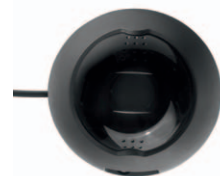
Handenhet Interlock® 7000