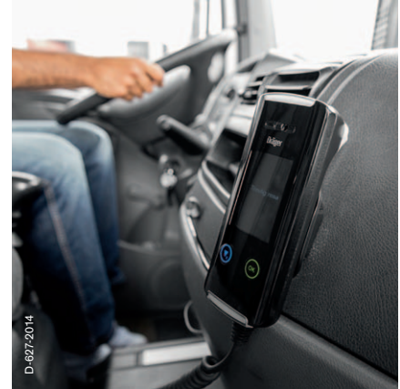
Användning i lastbilar